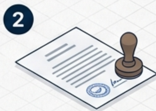
Despacho de Nomeação