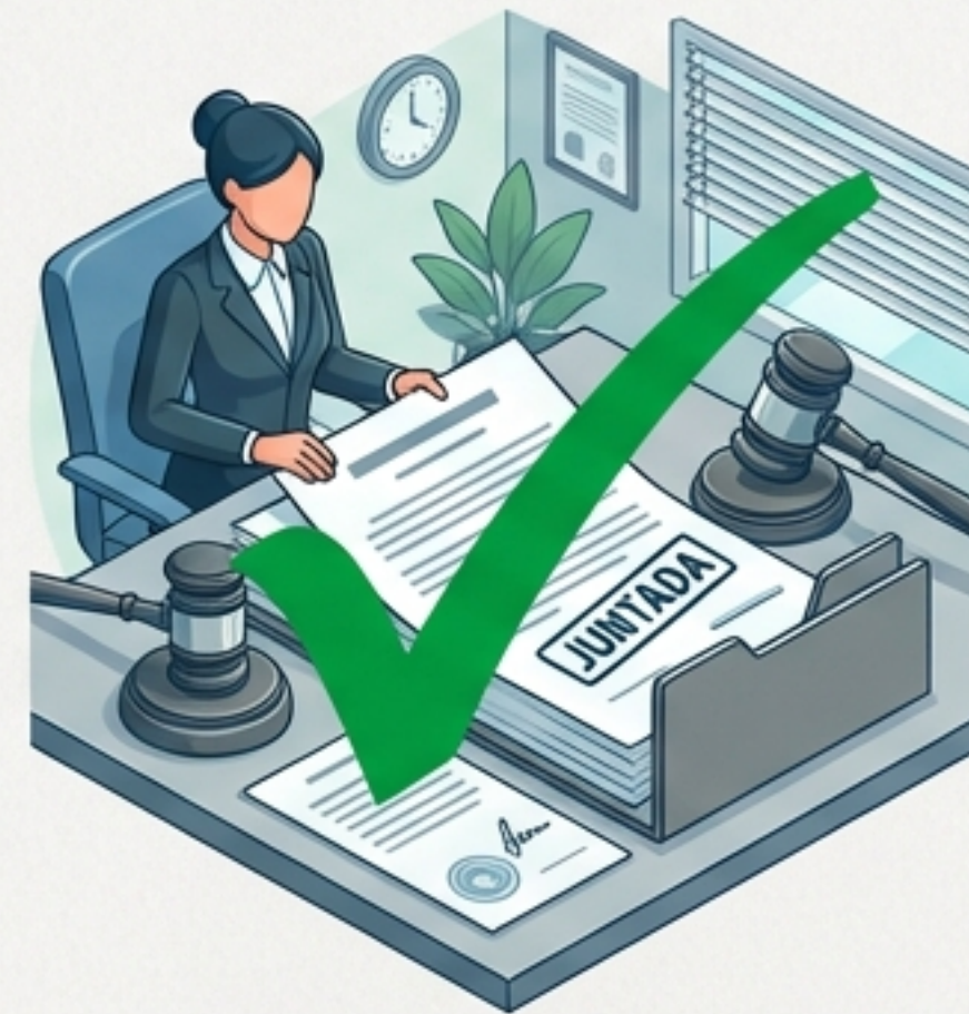
Juntada aos Autos