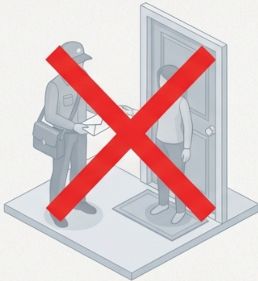
Assinatura na Porta

Exemplo: Você recebeu a carta na segunda-feira. O AR voltou e foi juntado aos autos na quinta-feira. O prazo começa a contar na sexta-feira.